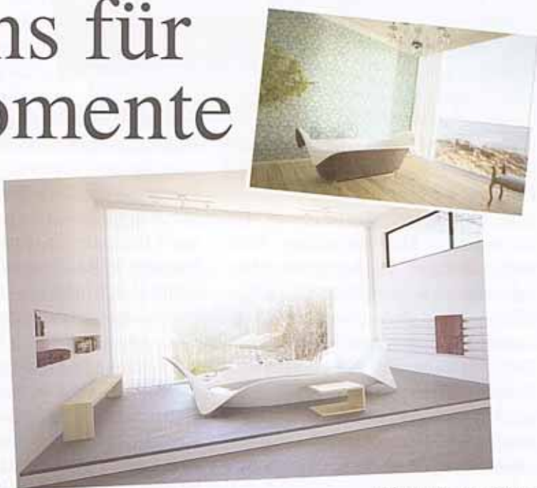
Oben: Ocean Wave Links: Ocean Wing.

Weitere Informationen finden Sie auf www.bagnosasso.ch .