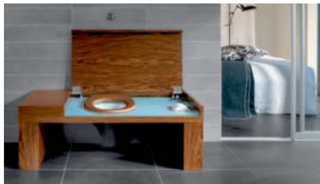
Smart Bench von Villeroy & Boch: Die Keramiktoilette versteckt sich in einer eleganten Holzbank.

viele Worte verliert. Die Wannen, erläutert er, seien dadurch federleicht und sehr gut haltbar, weshalb er eine Garantie über zehn Jahre ausstellen kann. Das könne sonst niemand.