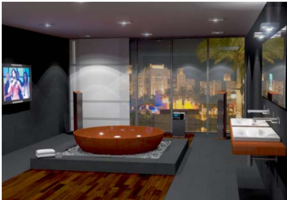
Holz setzt im Bad Akzente: Badezimmer mit Holzboden und Holzbadewanne, ein Vorschlag von Bagno Sasso.