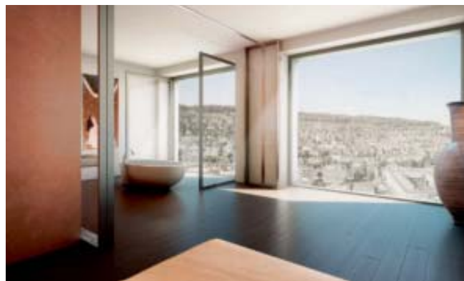
Fließende Übergänge zwischen Badezimmer und Wohnraum, hier am Beispiel des Zürcher Mobimo Tower.

Im Badbereich sind derzeit verschiedene Tendenzen auszumachen, die alle für den Einsatz Holz sprechen. So ist der Trend da zu offenen Übergängen zwischen Bad und Schlafzimmer, weshalb das Bad wohnlich gestaltet sein sollte. Das geht so weit, dass das Unternehmen Villeroy & Boch für das Bad Holzbänke designt hat, die sich beim Hochklappen der Sitzfläche als versteckte Toiletten entpuppen. Die Badezimmer mausern sich weiter immer mehr von der Nasszelle zur hippen Wellnessoase oder zum gemütlichen Rückzugsraum. Last not least wird beim Baddesign vermehrt berücksichtigt, dass es ein Raum ist, in dem sich der Mensch nackt, also ungeschützt, bewegt. Warme, heimelige Materialien sollen dafür sorgen, dass er sich dort wohl fühlt. Rolf Senti, Gründer und CEO des innovativen Inneneinrichtungsunternehmens Bagno Sasso, nennt noch einen Grund: «In der modernen Architektur kommt häufig Rohbeton zum Einsatz, ein sehr kaltes Material. Wenn man da mit der Einrichtung nicht Gegensteuer gibt, werden die Räume unwohnlich. Das gilt auch für die Badezimmer», erklärt er. Holz mildert auch die optische Kühle von Sanitärkeramik, ist daher ein idealer Baustoff fürs Bad. Zumal sich Wände und